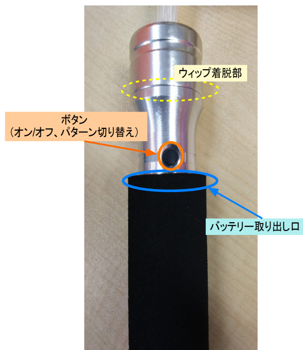
図1:ハンドル部説明

v.使用後に消灯する際は、ボタンを約2秒以上長押しして下さい。このとき一瞬消灯してから再度消灯すれば成功です。